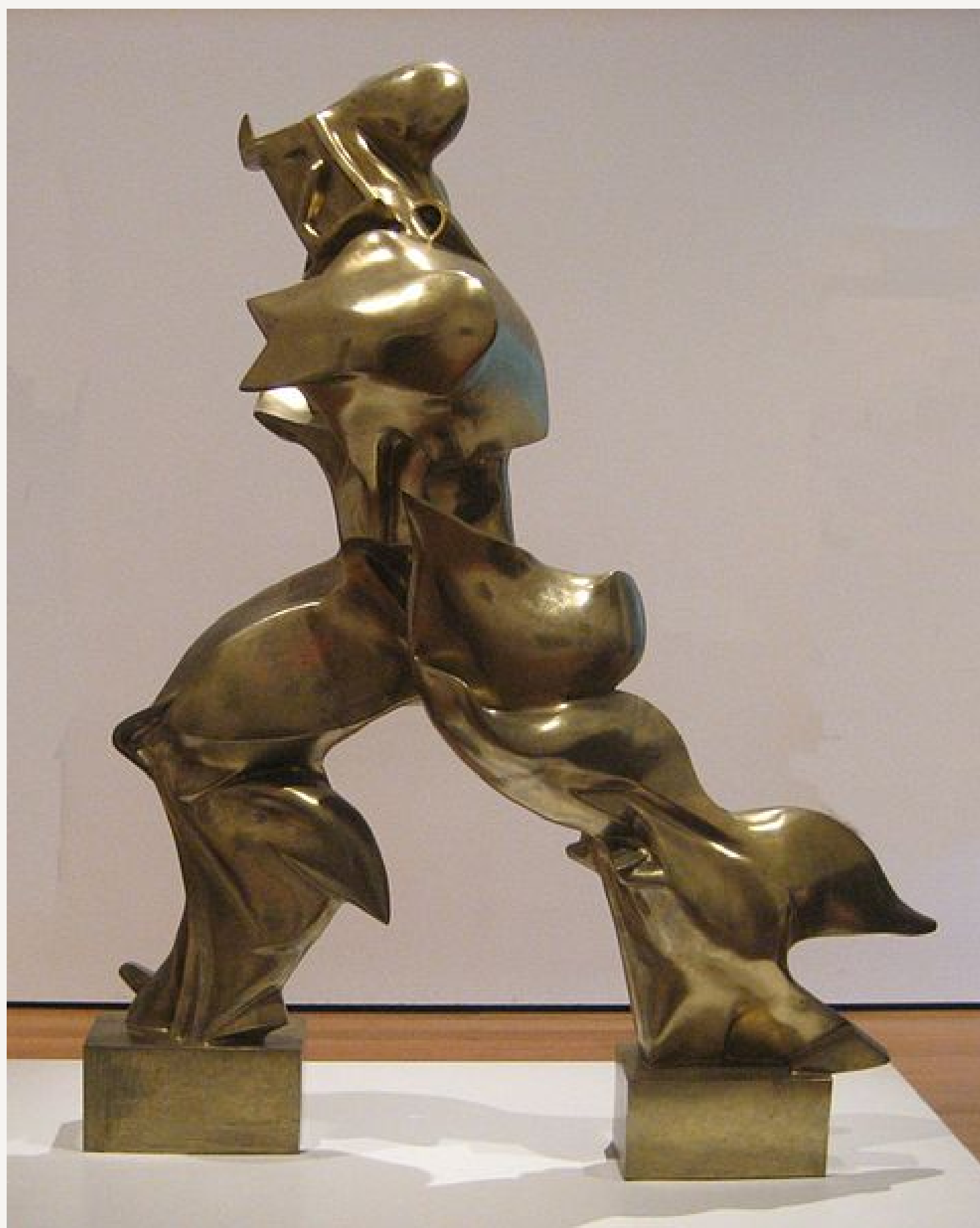
Umberto Boccioni, Jedinstveni oblici kontinuiteta u prostoru , 1913., Tip Bronca; Lokacija Museu de Arte Contemporânea da Universidade de São Paulo (originalna žbuka), São Paulo

Skulptura nas i dalje podsjeća na ljudsko tijelo u pokretu ali, je ono apstrahirano.