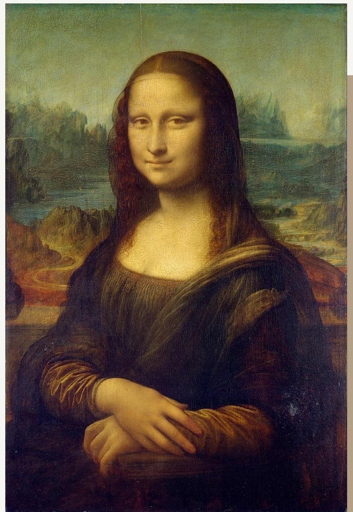
Leonardo da Vinci, Mona Lisa, ca. 1503. – 1507., ulje na drvu

To je čudesan portret žene koja se tajanstveno smiješi (zagonetni osmijeh) ispred rastaljenog pejzaža kamenja i rijeka. Portret žene je jako idealiziran iako je nastao po stvarnom modelu i u toj ravnoteži leži tajanstvenost ove slike.