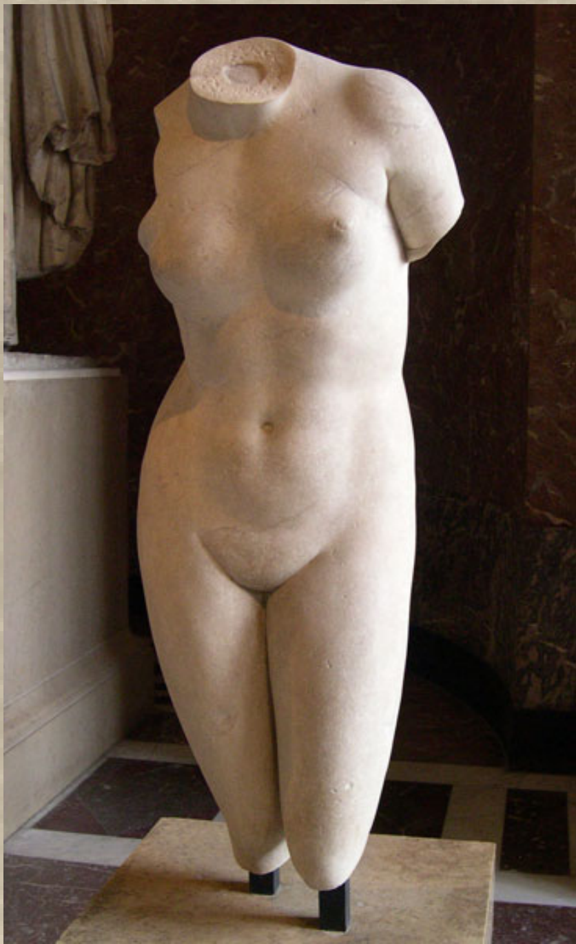
Knidska Afrodita , rimska kopija prema Praksitelovom originalu iz oko 340. - 330. pr. Kr., mramor, visina 2 m, Vatikanski muzej, Rim.