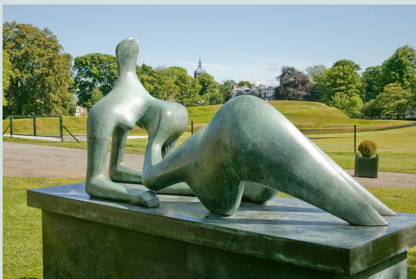
Henry Moore Reclining Figure 1951 Scottish National Gallery of Modern Art, Edinburgh © The Henry Moore Foundation. All Rights Reserved