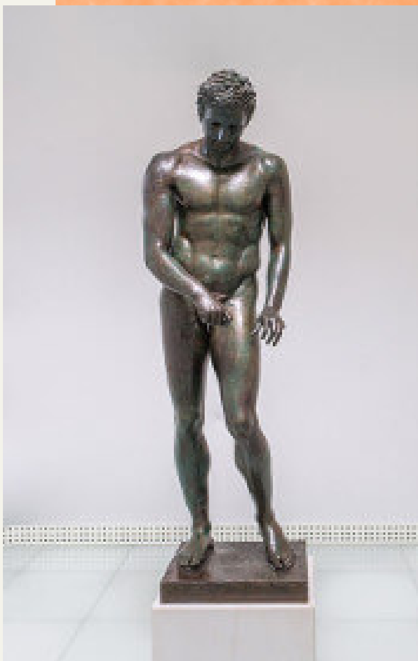
Hrvatski Apoksiomen ili Lošinjski Apoksiomen , brončani antički kip iz 2. ili 1. stoljeća pr. Kr., nepoznati autor