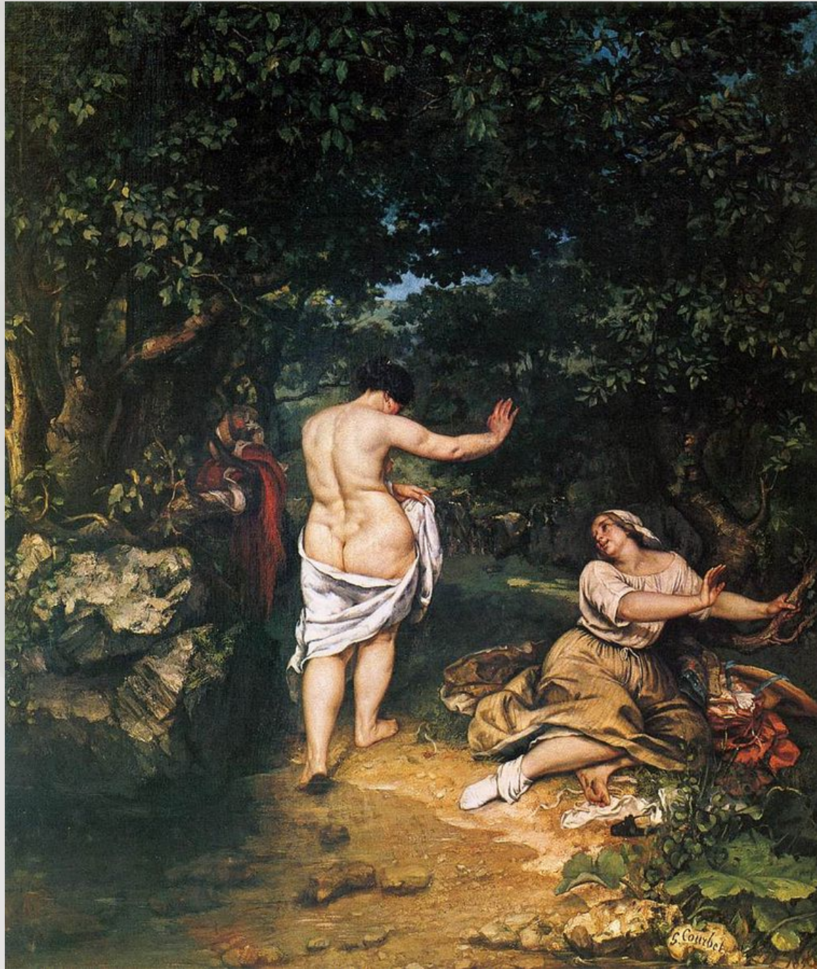
The Bathers , Gustave Courbet, ulje na platnu, 1853, Musée Fabre, Montpellier

stilski pravac koji teži postizanju iluzije zbilje