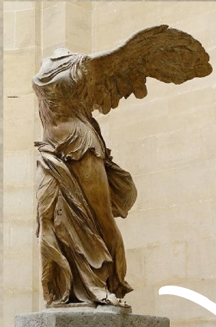
Nika sa Samotrake , djelo nepoznatog autora, 220. - 190. pr. Kr., Louvre, Pariz

dematerijalizacija tkanine stvara efekt prirodnosti