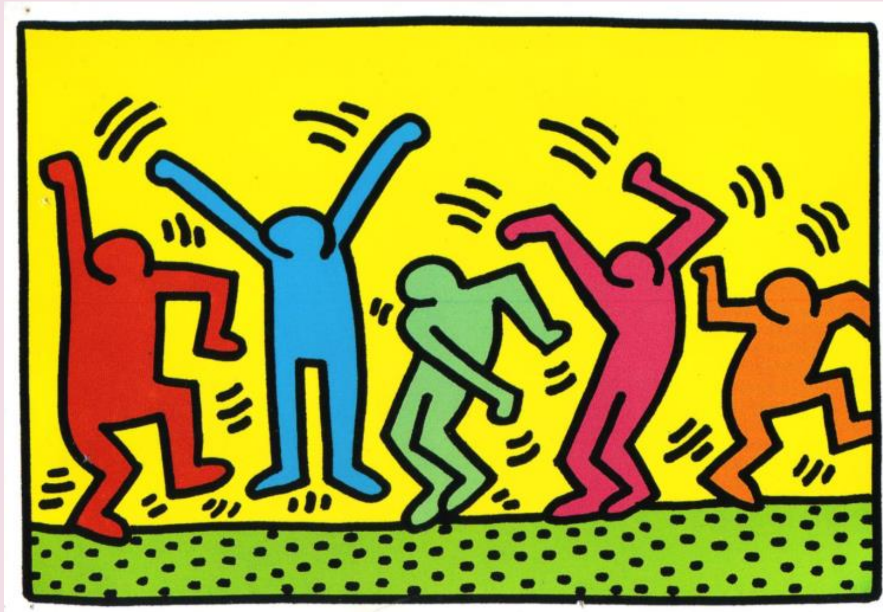
Untitled (Dance) , Keith Haring, 1987, poster

Keith Haring ljude prikazuje na osnovan tj. jednostavan način (stilizira ih) prikazuje ih stripovski i naznačuje oblik. Romanika također koristi stilizaciju za prikazivanje ljudi kao što vidimo na freskama, veličina Krista je naglašena zbog važnosti, a zanemaruje se anatomija skrivena iza stilizirane odjeće.