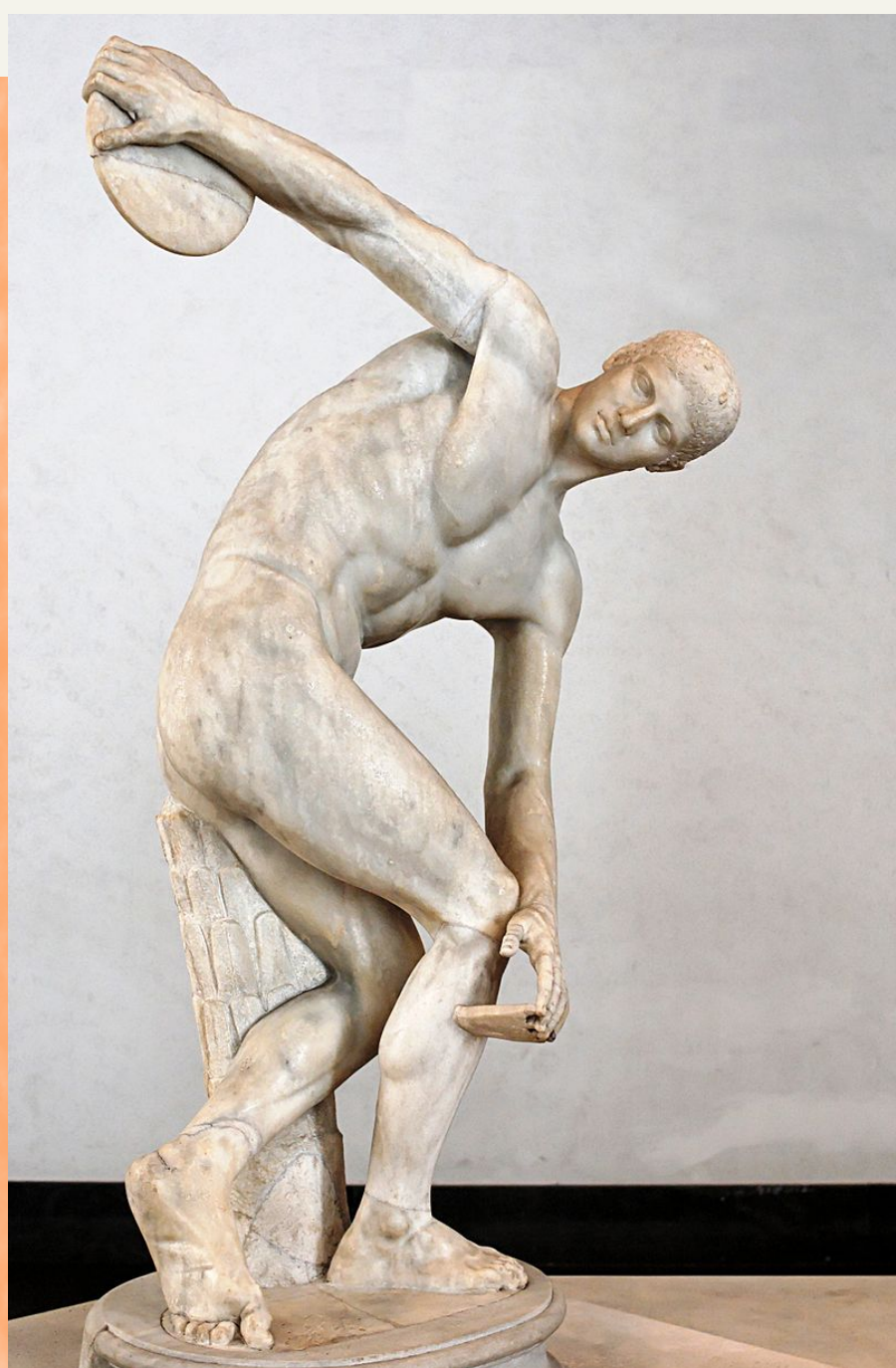
Miron, Diskobol (Bacač diska), rimska mramorna kopija iz 140. pr. Kr., Nacionalni muzej, Rim.