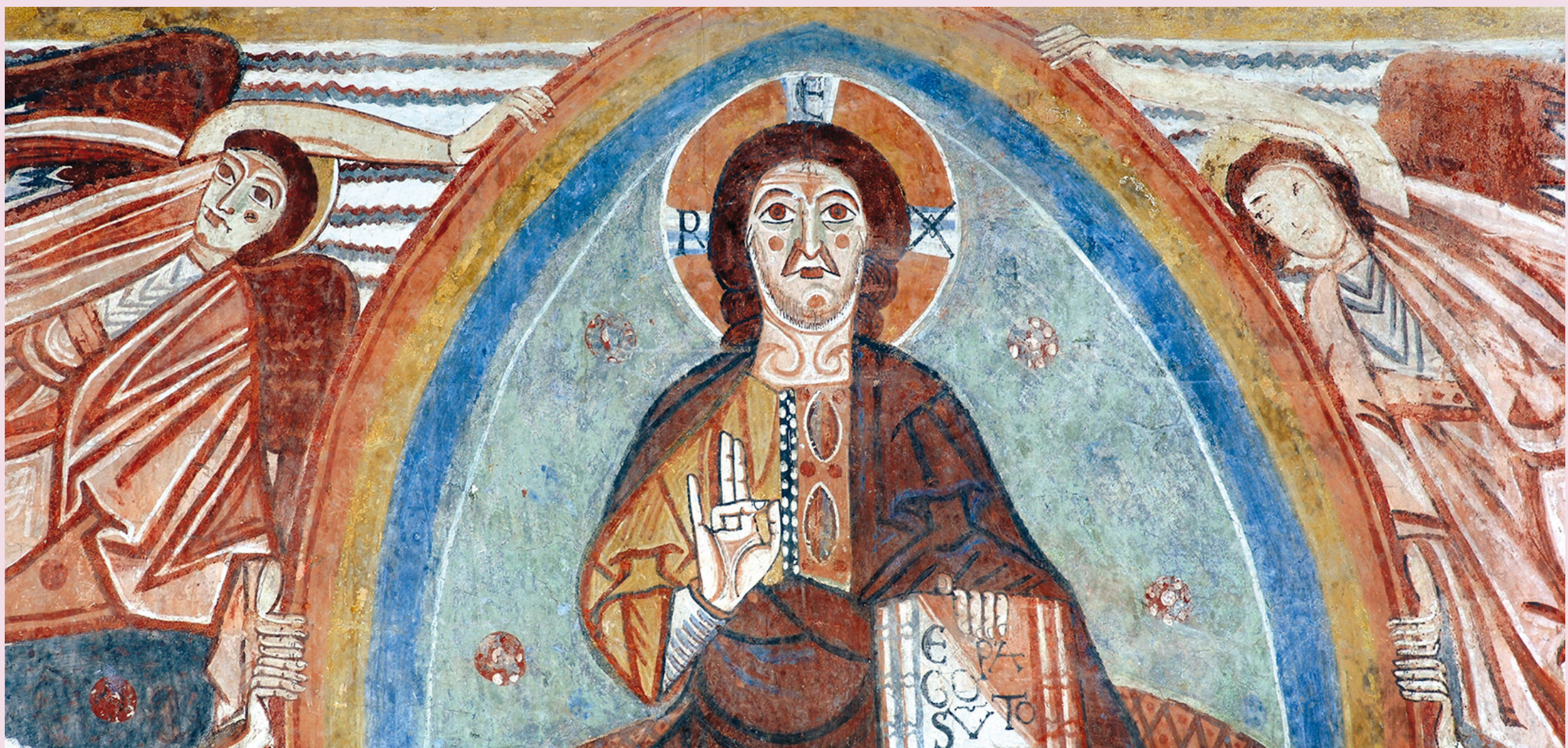
Zidna slika Uzašašće Kristovo u crkvi sv. Foške u Batvačima, XII. st.

Keith Haring ljude prikazuje na osnovan tj. jednostavan način (stilizira ih) prikazuje ih stripovski i naznačuje oblik. Romanika također koristi stilizaciju za prikazivanje ljudi kao što vidimo na freskama, veličina Krista je naglašena zbog važnosti, a zanemaruje se anatomija skrivena iza stilizirane odjeće.